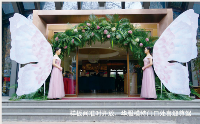
样板间准时开放，华服模特门口处喜迎尊驾

3月9日，泉舜上城【一城春色·泉景盛放】网红样板区盛大开启。借由“一环正央、双地铁口”的绝对优势，在短短一天时间内便吸引超千人到访，再一次证明了泉舜的品牌向心力和产品打造力！