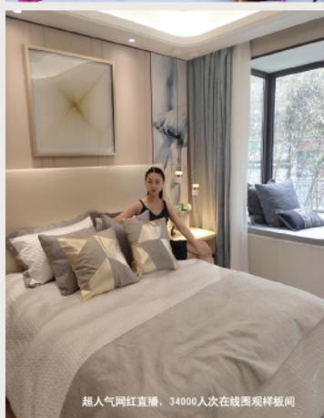
超人气网红直播，34000人次在线围观样板间

作为泉舜集团落地郑州的首个城市级封面作品，泉舜上城在产品端突破传统作风，以“人的舒适度”为核心概念，匠心打造而出建筑面积约90/129㎡两大“户型之王”。在升级空间格局的同时，亦全面升级了居住体验，充分满足全家庭型成员不同的生活方式，为城市中心生活带来革命性改变。