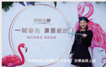
全郑州最大的网红打卡圣地，空降泉舜上城