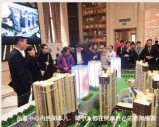
品鉴中心内热闹非凡，每个人都在施展自己的创意脑洞