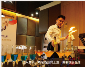
步入其中，鸡尾酒派对上演，调制缤纷生活